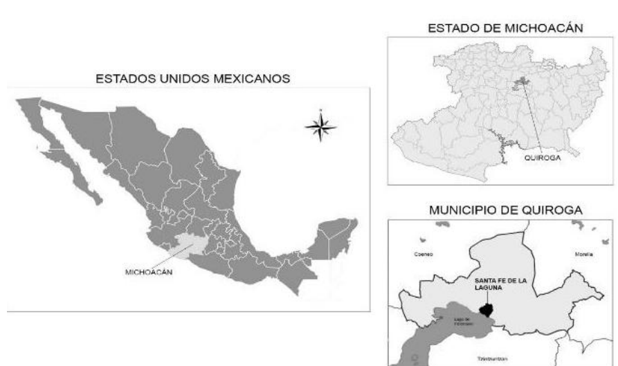
Santa Fe de la Laguna

En cuanto a los orígenes de la comunidad, de acuerdo a los relatos de comuneros y comuneras de Santa Fe y a Jerónimo de Alcalá en su obra La Relación de Michoacán , durante el periodo previo a la