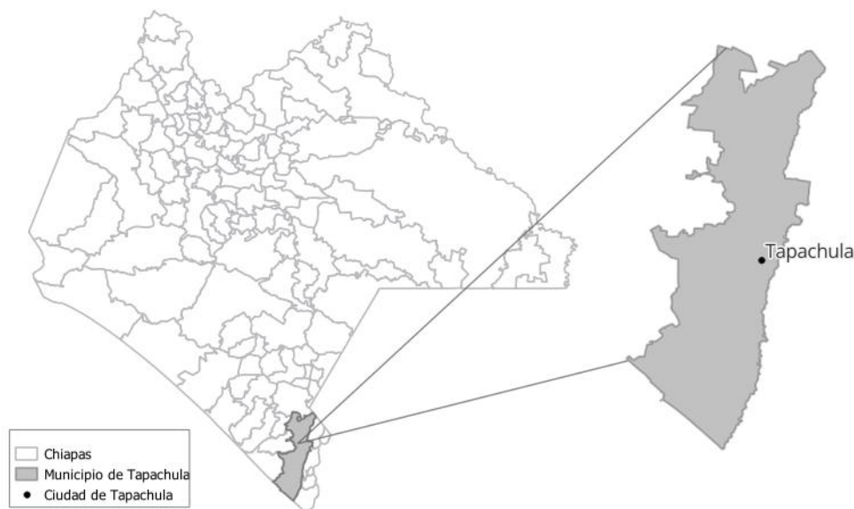
Mapa del Municipio de Tapachula