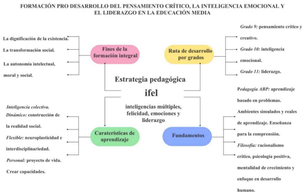
Mentefacto estrategia pedagógica IFEL