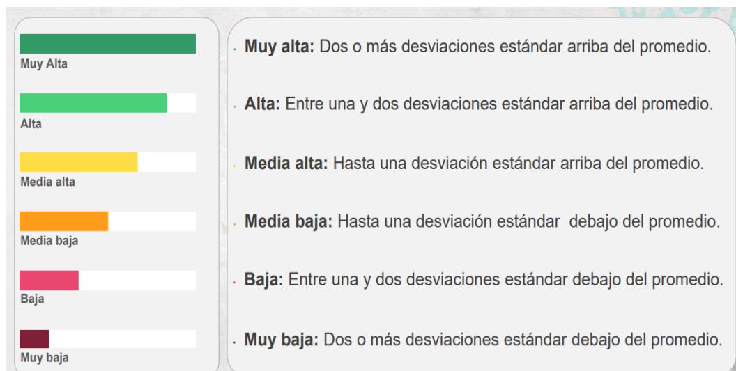
Escala de evaluación del Índice de Competitividad Urbana (ICU)