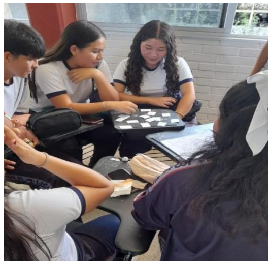
Lotería de emociones