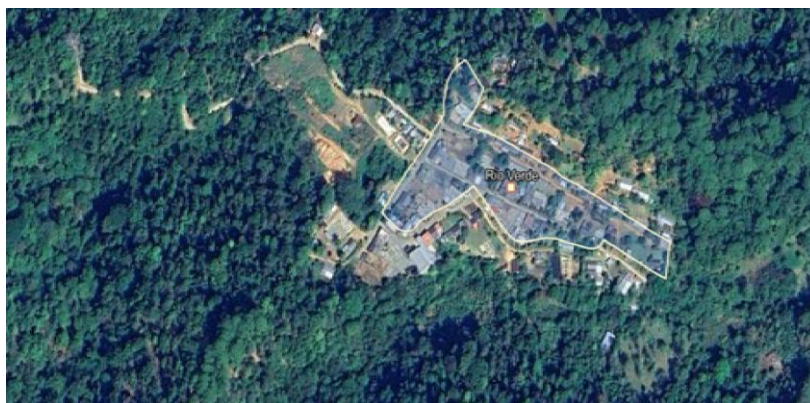
Localidad Río Verde