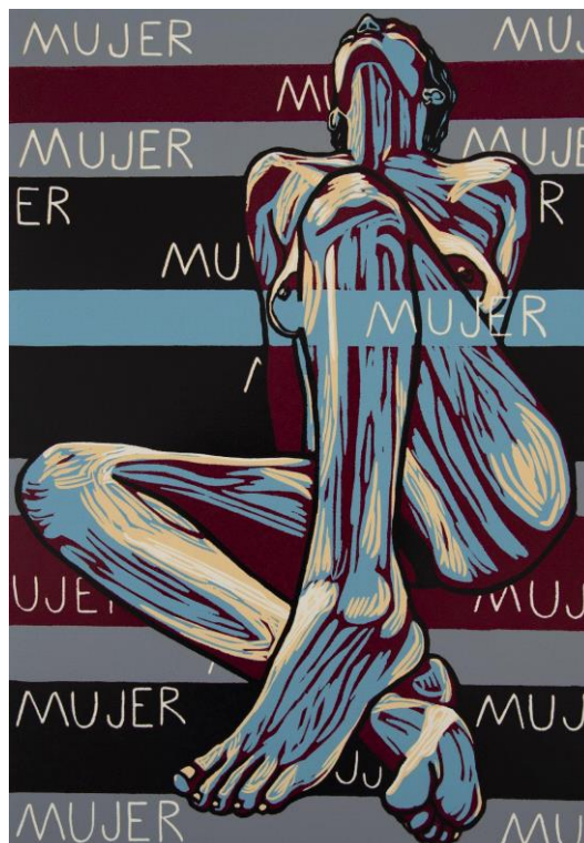
Figura y Palabra (Dedicatoria II)